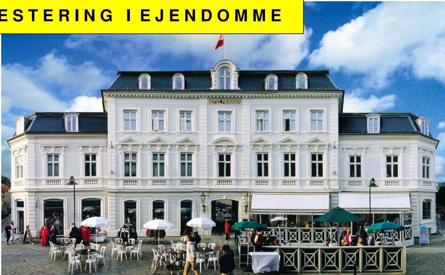
Hotel Prindsen, Roskilde – Ny investering i 2007