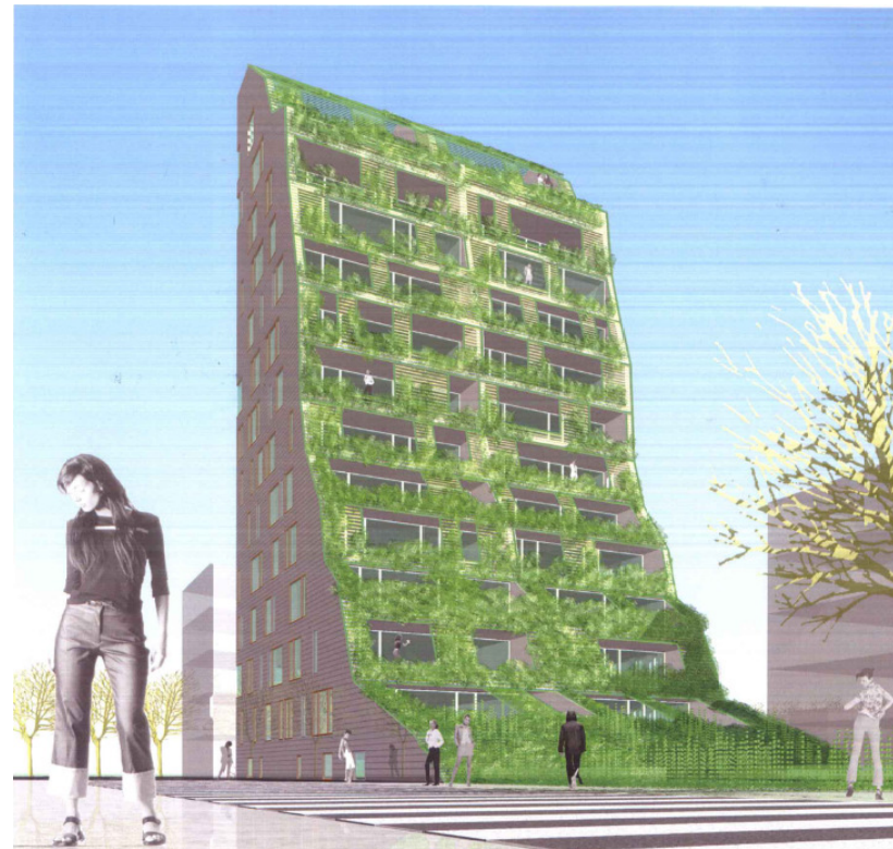
Amager Strand. 500 lejligheder