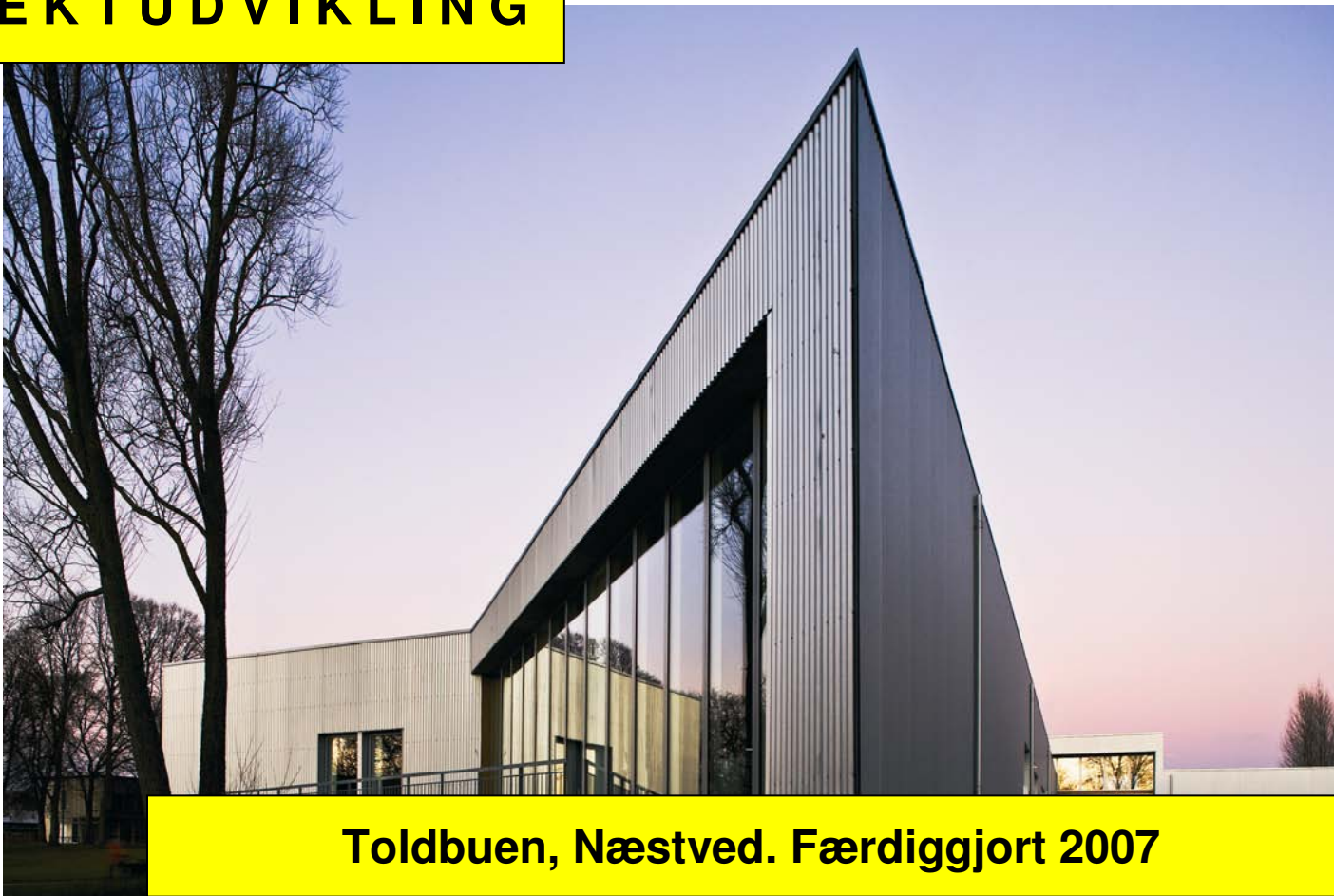
Toldbuen, Næstved. Færdiggjort 2007