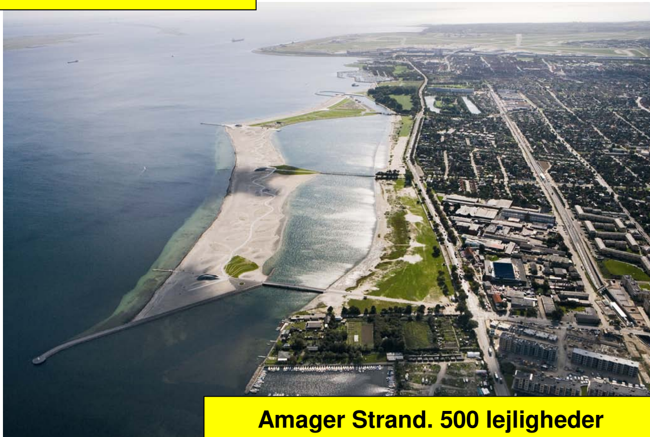
Amager Strand. 500 lejligheder