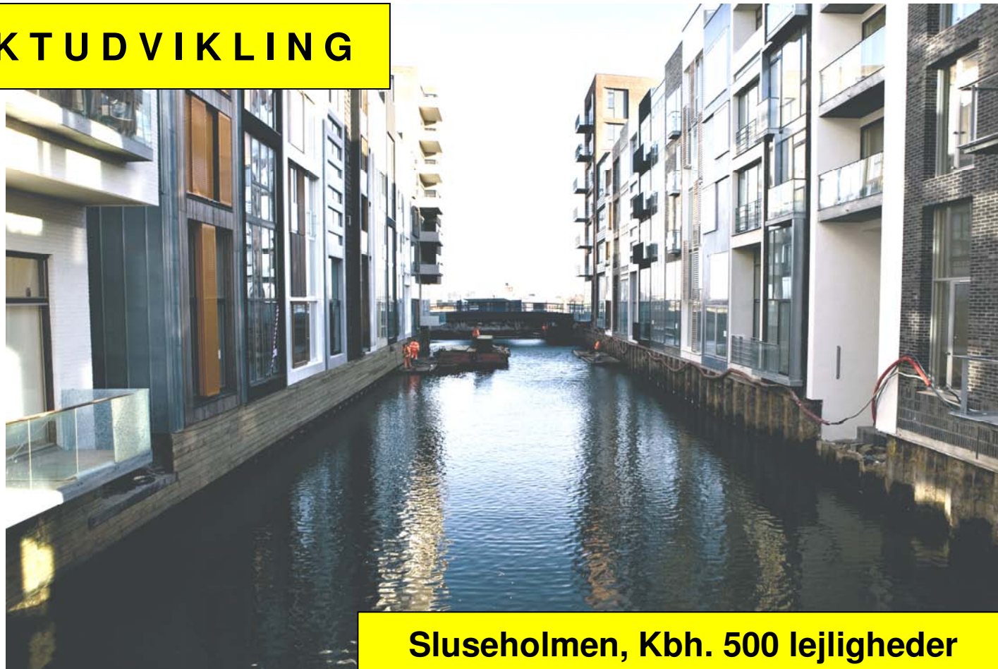
Sluseholmen, Kbh. 500 lejligheder